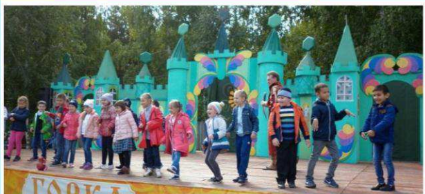
Учащиеся 7 класса