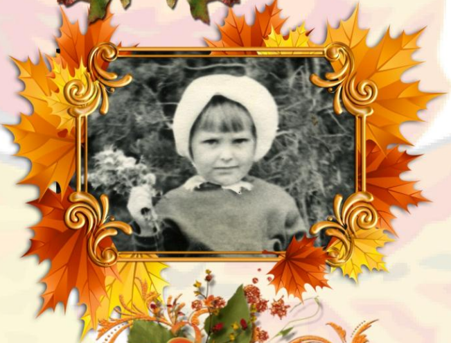
«Дырка от булбиска»