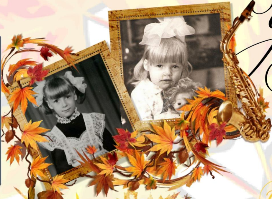
«Я не ору! Я объясняю!»